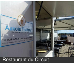
Restaurant du Circuit

Complexe Automobile 21320 MEILLY-SUR- ROUVRES Tél : 06 18 86 91 18