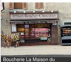
Boucherie La Maison du

15 Avenue Du Général De Gaulle 21320 POUILLY-EN- AUXOIS Tél : 03 80 90 71 54 Lamaisonducharolais.Com