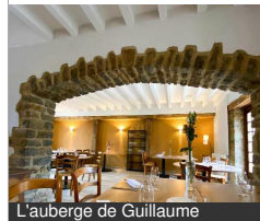
L'auberge de Guillaume

4 Place De La Mairie 21320 VANDENESSE-EN- AUXOIS Tél : 03 80 49 22 36 m