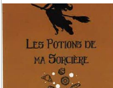
Les Potions de ma sorcière