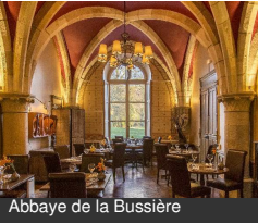
Abbaye de la Bussière

RD 33 21360 LA BUSSIÈRE-SUR- OUCHE Tél : 03 80 49 02 29, 03 80 49 02 29