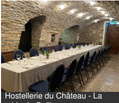
Hostellerie du Château - La

Grande Rue 21320 CHATEAUNEUF Tél : 03 80 49 22 00 Hostellerie-De- Chateauneuf.Com