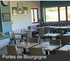
Portes de Bourgogne

Avenue Georges Besse 21320 CREANCEY Tél : 03 80 64 45 41