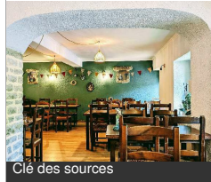
Clé des sources

4 Route De Bligny 21360 LUSIGNY-SUR- OUCHE Tél : 03 45 46 25 59