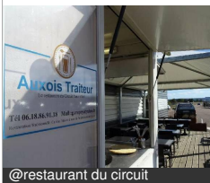
@restaurant du circuit

Complexe Automobile 21320 MEILLY-SUR- ROUVRES Tél : 06 18 86 91 18